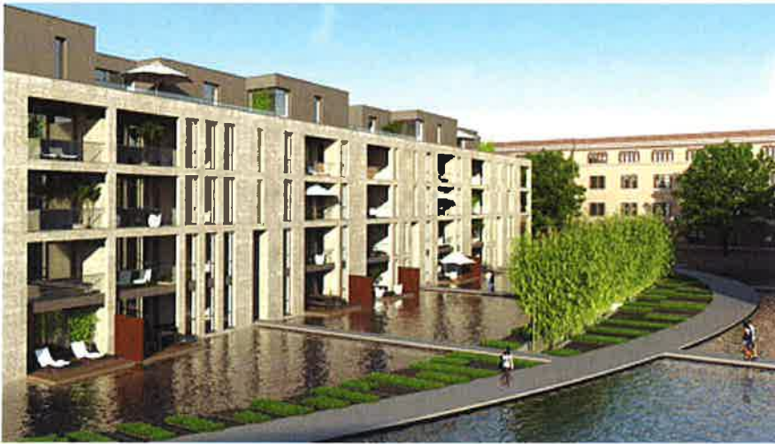
Animationen des Wohnquartiers "Parklane" (2 Bilder).

Das Quartier Parklane unterscheidet sich durch die städtebauliche Struktur und architektonische Qualität der Gebäude deutlich von der umgebenden Bebauung. Die klaren Linien der Architektur, die kubischen Formen und ausdrucksstarken, modern gestalteten Fassaden kennzeichnen das Ensemble und bilden einen Dialog zu den denkmalgeschützten Ziegelbauten des Geschwister-Scholl-Hauses und der historischen Reithalle.