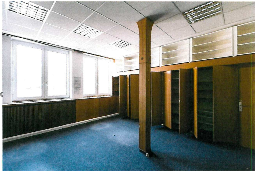
Blick in die Atelierräume im ehemaligen Landeskriminalamt in Düsseldorf-Unterbilk.